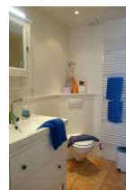
Das Badezimmer im Obergeschoß mit.....