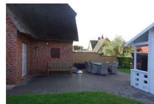
Die Terrasse im Herbstschlaf, rechts im Bild das Saunahaus