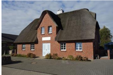
Das Doppelhaus Golfoase, Haus 1 befindet sich rechts

Die Unterkunft verteilt sich über EG und 1.OG.