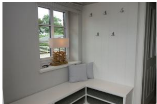
Der Eingangsbereich, Platz für Outdoorkleidung und Schuhe

Im idyllischen Ort Oevenum finden Sie das Doppelhaus Golfoase. Zwei großzügige Doppelhaushälften für je 6 Personen erwarten Sie. Ein gemütliches Wohnzimmer mit offener Küche und familientauglichem Essplatz, Austritt in den Garten und zur möblierten Terrasse, Sauna (mit Zusatzkostenverbunden). Ein großes Badezimmer mit Waschmaschine und Trockner. Im Obergeschoß die Schlafräume und ein weiteres Dusch+Wannenbad. Hier ist an alles gedacht, hier kann man sich wohlfühlen, hier... wird es Ihnen einfach nur gut gehen und das Beste.....Ihr Vierbeiner darf auch dabei sein.