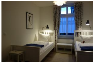
Das zweite Schlafzimmer, neu möbliert mit zwei Einzelbetten a 90x200cm....