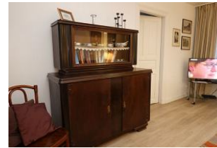
.....Nostalgie pur ...