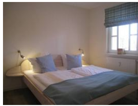
Das Elternschlafzimmer mit großem Doppelbett 180x200cm