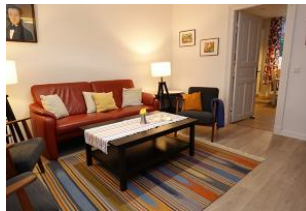
Das farbenfrohe Wohnzimmer bringt gute Laune...