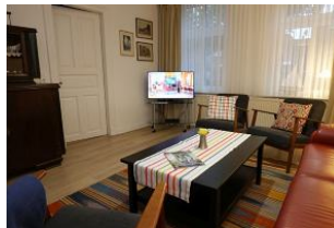
...das TV Gerät darf natürlich auch nicht fehlen....