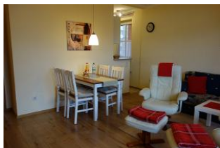
Der Essplatz, im Hintergrund die Küche.