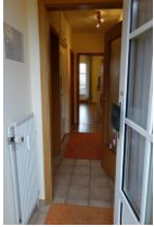
Der Eingangsflur....treten Sie ein..