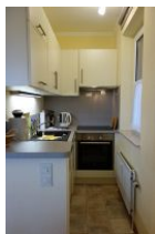
Die neue Küche mit Geschirrspüler, Backofen und Mikrowelle