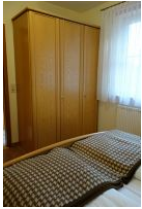
Ein großer Schrank für Ihre Kofferinhalte.