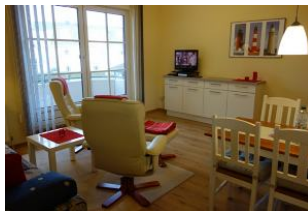
Zwei Relaxsessel zum Fernsehen, entspannen, lesen ....