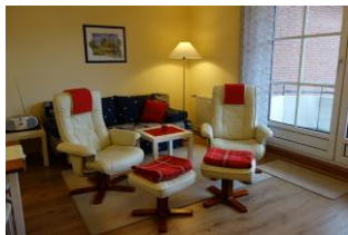
Das neue Wohnzimmer mit Laminatboden.

Sie suchen Entspannung ? Relaxsessel heißt das Zauberwort. Diese bieten wir Ihnen in einer gepflegten Zwei - Zimmer - Wohnung unweit vom Wyker Südstrand an. Die kleine Küche und das Wohnzimmer mit Austritt auf den Balkon sind komfortabel ausgestattet. Das Duschbad verfügt über eine hohe Duschwanne. Das Schlafzimmer mit großem Doppelbett ist gemütlich eingerichtet.