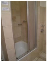
.. Dusche mit tiefer Wanne.