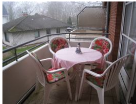
Und der herrliche Balkon.....