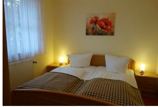
Schlafzimmer mit großem Doppelbett