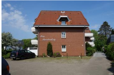
Die Aussenansicht des Hauses Meeresbrandung Gmelinstr. 12 in Wyk