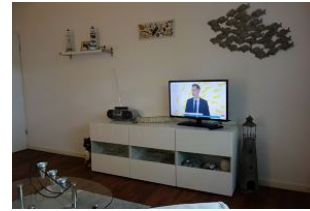
...für einen TV - Abend ?