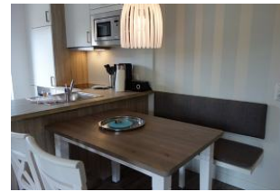
.Der Esstisch - Anschluss.....