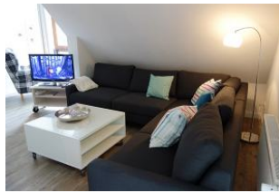
...hier finden alle Familienmitglieder ein Plätzchen