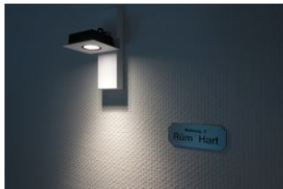
Die Wohnung 3 - Rüm Hart lädt ein .....