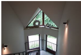
Das Treppenhaus im Haus Neshörn