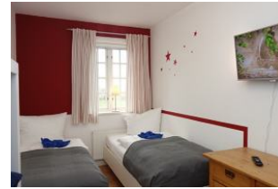
Das Kinderzimmer mit zwei Einzelbetten a 90x200cm, TV Gerät