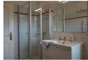
Das Duschbad mit Handwaschbecken und Dusche, nicht im Bild die Toilette + Waschmaschine und Fenster