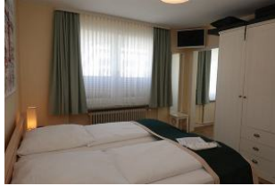
im Schlafzimmer ein großes Fenster und ein zus. TV Gerät