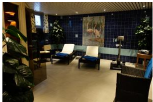
Der Fitnessbereich im Untergeschoß mit ...