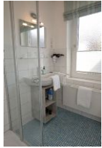
Das Bad mit Handwaschbecken und ...