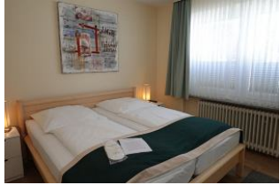
Das große Bett misst 180x200cm