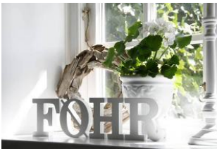
F O E H R