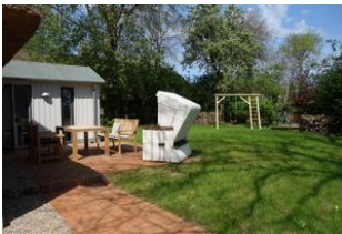
Die Terrasse hinter dem Haus mit dem Garten - nur für Sie zu nutzen. Der Austritt auf die Terrasse befindet sich im Essbereich