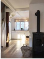
Der Blick vom Wohnzimmer zur Küche, vorbei am dänischen Ofen.