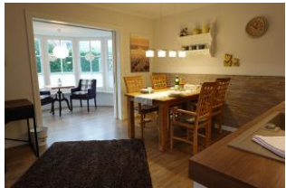
Der Essplatz, im Hintergrund die Veranda