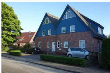
Das Haus Olhörnstieg 6, die Unterkunft befindet sich im Erdgeschoss links