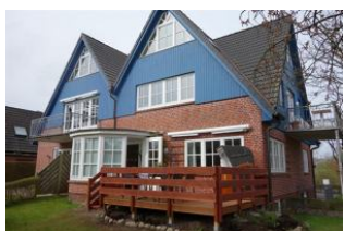
Das Haus Olhörnstieg 6 vom Garten aus gesehen. Die Holzterrasse gehört zu "Ihrer" Wohnung.