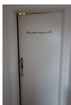
...seien Sie gespannt und treten Sie ein ....