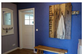
Der Flur mit großer Garderobe...