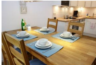
....nehmen Sie Platz, sieht aus, als gäbe es bald etwas zu essen.