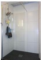
...mit großem Duschbereich.