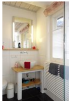
Das Bad im Erdgeschoß...