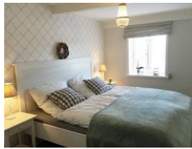
Das Doppelschlafzimmer (Bettmaaß 180x200cm) im Erdgeschoß mit ...