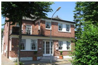
Das Haus Hallig Hooge in der Friedrichstrasse in Wyk