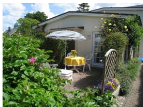
Die herrliche Terrasse. Zugang vom Wohnzimmer aus.

Ruhig gelegen, inmitten unseres kleinen Städtchens Wyk finden Sie unser Haus Hallig Hooge, welches insgesamt 7 Wohnungen für 2 Personen beherbergt.. Das Appartement Oland ist ein gemütliches Feriendomizil, in dem Sie alles finden "was man so braucht" Hier, abseits von Hektik und Stress werden Sie schnell den Alltag vergessen. Lassen Sie die Seele baumeln, atmen Sie tief durch und genießen Sie die Föhler Luft. Das Haus Hallig Hooge liegt so zentral, daß auch Ihr Auto Urlaub machen kann.