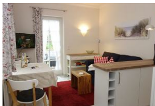
Der Blick ins Wohnzimmer