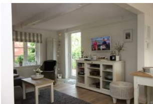
Blick ins Wohn-/Esszimmer