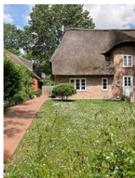
Die linke Hälfte des Hauses Buurnstrat 40 - WattLütt

Die Unterkunft verteilt sich über EG und 1.OG.