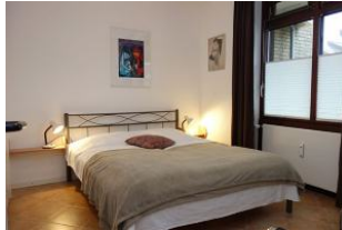
Das Schlafzimmer mit Doppelbett 160x200cm