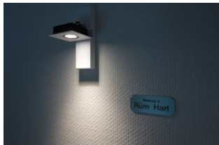
Die Wohnung 3 - Rüm Hart lädt ein .....