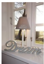
I had a dream.....