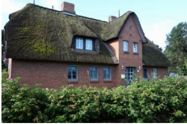
Das Haus Bredland 2a Die Whg.4 befindet sich im 1.OG links