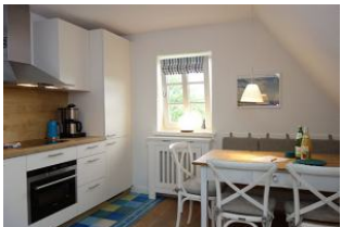
Der Esstisch mit Bank und drei Stühlen