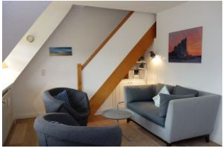
Gemütliche Sitzecke mit kleiner Couch und zwei Sesseln

Komfortable, in warmen Farben eingerichtete OG-Wohnung für 2-4 Personen. Auf halbem Weg zwischen Wyk und Nieblum steht dieses Reetdachhaus mit 4 Wohneinheiten. Wer die Ruhe sucht, den weiten Blick über Pferdekoppeln liebt, wohnt hier genau richtig. Das Meer ist so nah, man kann es fast riechen. Ideal auch für Golfer, denn der Golfplatz ist zu Fuß erreichbar.