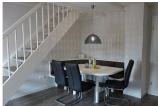
Der große Essplatz für Alle