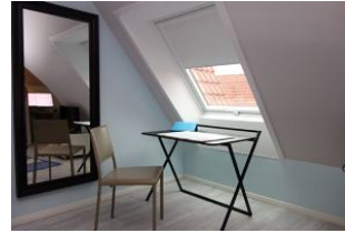
...ganz neu: ein Home-office-Platz