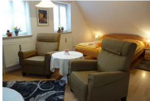
Zwei einladende Sessel für einen ausgedehnten TV - Abend.