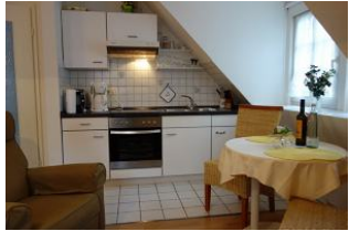
Die offene Küchenzeile mit kleinem Essplatz.

Zentralgelegenes Ein-Raum-Appartement in der Mühlenstrasse für den kleinen Geldbeutel. Wer "mitten drin" wohnen will, keinen Wert auf eine große Wohnung legt, viel unterwegs sein möchte und nur "ein Bett zum schlafen" benötigt, bucht hier genau richtig.