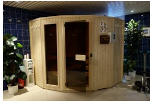
....Sauna und ...