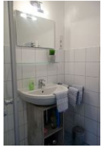
...mit Handwaschbecken und genügend Ablagefläche