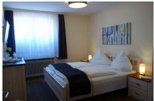
Das Schlafzimmer mit Doppelbett (180x200cm) Laminatfußboden