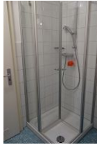
... und Dusche