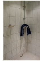
....Dusche und ...