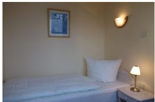
Vom Schlafzimmer aus zu begehen: noch ein kleines Zimmer mit Einzelbett