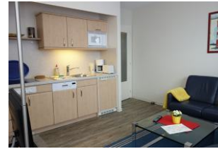
Hier noch einmal die Küchenzeile