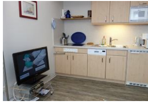
Die offene Küchenzeile