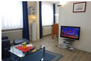
TV Gerät, im Hintergrund das Esszimmer