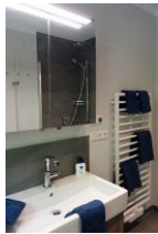
Das Bad mit Handwaschbecken und Toilette (nicht im Bild)....