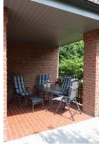
...herrlich, auf der überdachten Terrasse kann man auch Abends lange draußen sitzen...