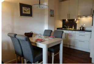
...hier noch einmal der Esstisch