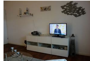
...für einen TV - Abend ?