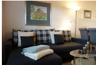
...ein gemütliches Plätzchen...