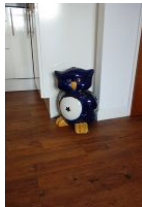
...die Namensgeberin der Wohnung: die Eule

Klein - aber mein, könnte man zum Eulennest sagen. Diese geschmackvoll eingerichtete Wohnung - im Herbst 2013 komplett renoviert und neu eingerichtet - bietet zwei Personen Platz für einen erholsamen Urlaub. Das Wohnzimmer mit offener Küchenzeile, Austritt auf die Terrasse, das sep. Schlafzimmer, das Wannenbad mit Duschabtrennung bieten genügend Raum. Mitten in der Stadt, unweit des Storchensparks und nur wenige Gehminuten zum Strand, eine komfortable Wohnung zu ebener Erde - was braucht es noch zur guten Erholung ?