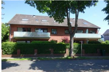
Die Aussenansicht des Hauses Feldstr. 18 in Wyk