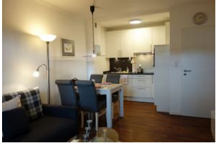
Der Essplatz als Insel zwischen Küche und Wohnzimmer