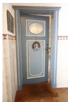
...treten Sie ein...