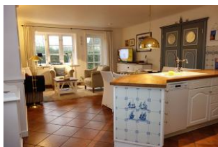
... und lassen sich verzaubern, von dieser gemütlichen Wohnung.