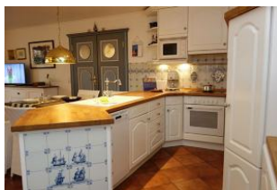
...gleich rechts, die offene Küche.