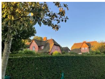
Die Häuser Dörpstrat 93+93a Das linke Haus ist die Nummer 93a