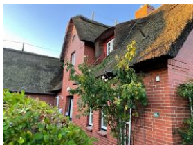
...hinter den Hecken versteckt, der Hauseingang.

Die Sonnenblume - herrlich gemütlich, im friesischen Stil eingerichtet, in "Friesenblau" gestrichene Türen, alten friesischen Kacheln und mit unendlich viel Liebe zum Detail eingerichtet. Hier passt alles zusammen, auf Komfort muss niemand verzichten. Vom Wohnzimmer aus können Sie auf die Terrasse gehen und den Garten nutzen, der so eingewachsen ist, dass keine neugierigen Blicke stören.