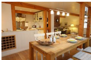
Der Tisch ist schon gedeckt, wer kocht ???