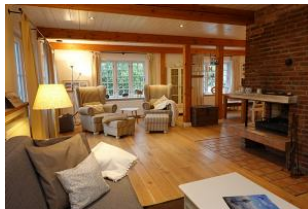
...gemütliche Couch, 2 Sessel und der Kamin - was braucht man mehr ?