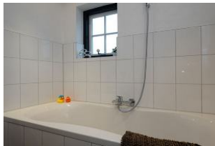
...die Badewanne für das "Relaxprogramm"