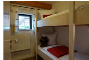
..klein aber fein, das Kinderzimmer mit Etagenbett. Nicht im Bild, ein kleines TV Gerät