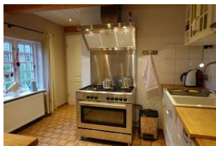
...ein Kinderspiel bei einem solchen Gasherd....