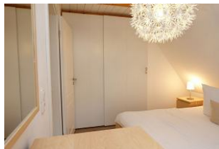
...mit großem Kleiderschrank