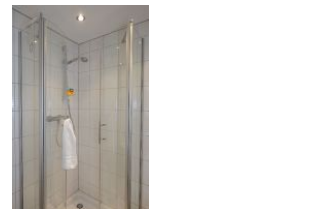
Das Badezimmer im Obergeschoß mit Dusche....