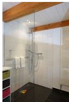
...hier noch einmal aus der Nähe