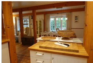
Der Blick von der Küche in den Essbereich.