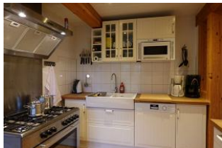
Die ganze Küche.