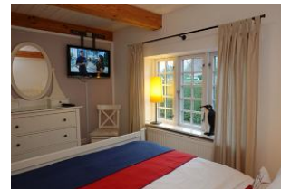
...mit zus. TV Gerät