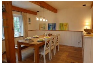
Ein Esstisch für Alle.