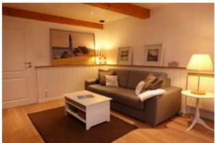
...hier noch einmal die Couchecke...