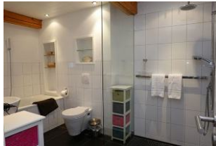
Das Bad im Erdgeschoß mit bodengleicher Dusche