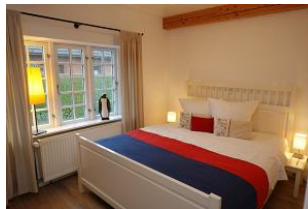
Das Elternschlafzimmer im Erdgeschoß..