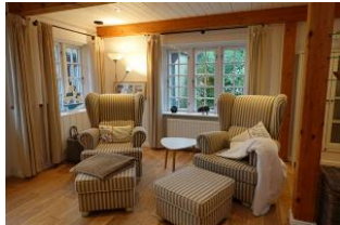
...und die Sessel für die Lese-, oder "Klönstunde"