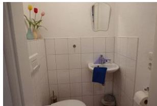
Das Gäste - WC im Erdgeschoß