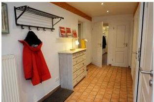
...treten Sie ein, schauen sich um ...

Das Haus Friesengeist in Wrixum für max. 7 Personen hat seine Besonderheiten. Ursprünglich als 2-Familien-Haus gedacht, vermieten wir nur noch an eine Gästepartie, niemand stört den Anderen. So verfügt das Friesengeist über zwei voll eingerichtete Wohneinheiten, dadurch gibt es für jedes Familienmitglied eine Rückzugsmöglichkeit. Ideal für mehrere Generationen, die gemeinsam Urlaub machen, aber auch gern einmal eine Tür hinter sich schließen möchten. Ein gemütliches, altes Friesenhaus in der Stille Wrixums - herrlich !