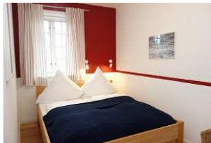
Ein weiteres Schlafzimmer mit Doppelbett 160x200cm