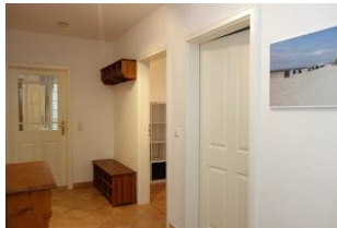
Treten Sie ein ....