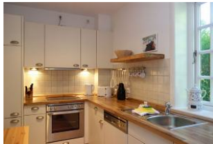
Der Blick in die Küche....