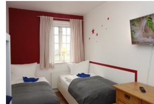
Das Kinderzimmer mit zwei Einzelbetten a 90x200cm, TV Gerät

Das Duschbad mit Handwaschbecken und Dusche, nicht im Bild die Toilette + Waschmaschine und Fenster