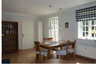
...der Esstisch hat für alle Platz! Im Hintergrund die Tür zur Küche