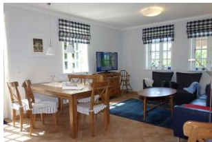
Essplatz und TV Gerät