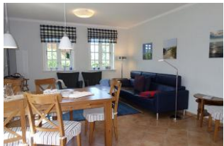
Ein Blick ins Wohn/Esszimmer - einladend....