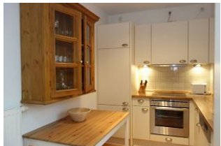
..der alte Schrank beherbergt die Gläser...