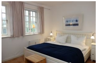
Das Elternschlafzimmer mit großem Doppelbett 180x200cm