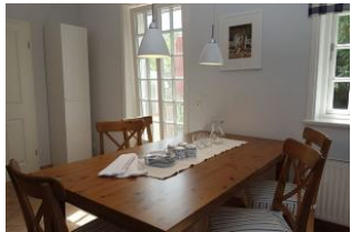
...nehmen Sie Platz, es scheint, als gäbe es gleich etwas zu essen...