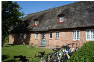
Der Eingang zu den Wohnungen 1, 2, 4 und 5

Das Hus Dikstian in Alkersum mit insgesamt 5 Wohneinheiten bietet auch befreundeten Familien die Möglichkeit "unter einem Dach" zu wohnen. Die Wohnung 1 befindet sich im hinteren Teil des Hauses, welches zum Garten gelegen ist. Sie verfügt über 3 Schlafzimmer mit 6 Betten normaler Größe. Das große Wohn/Esszimmer bietet jedem Familienmitglied ein Plätzchen. Die sep. Küche, voll eingerichtet, gibt auch dem Hobbykoch eine Chance. Das reetgedeckte Haus steht auf einem großen Grundstück, welches für alle Gäste zu nutzen ist. Zu jeder Wohnung gehört eine eigene Terrasse. Parkplatz auf dem Grundstück.