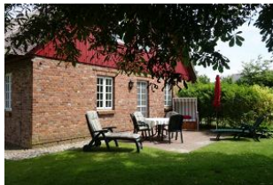
Auf der Terrasse erwartet Sie ein Strandkorb, Tisch und Stühle sowie eine Liege.