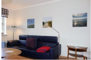
...die Couch im XXL-Format