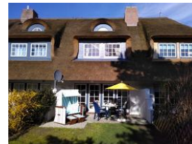
Die Terrasse bei herrlichem Wetter.....