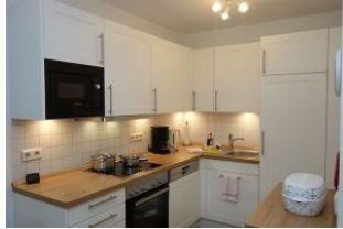
...mit viel Platz für Küchenutensilien