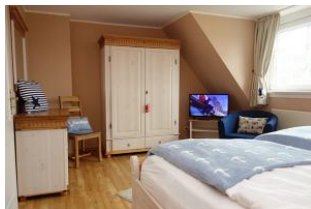
....zur Entspannung noch ein wenig fernsehen ?