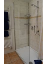
.. großer Dusche, Echtglaswand.