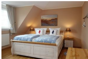
Das Elternschlafzimmer mit großem Doppelbett (180x200cm)