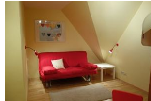
Das Durchgangszimmer mit moderner Couch zum lesen und klönen....