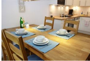
....nehmen Sie Platz, sieht aus, als gäbe es bald etwas zu essen.