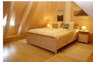
Ein weiteres Schlafzimmer mit Doppelbett (180x200cm)