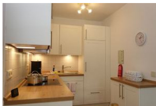
...die neue 03/2022 Einbauküche