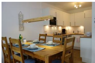
Der Große Esstisch hat für Jeden ein Plätzchen. Im Hintergrund die Küche.