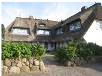
Das Eckhus im Hochstieg 22

Die Unterkunft verteilt sich über EG, 1.OG und DG.