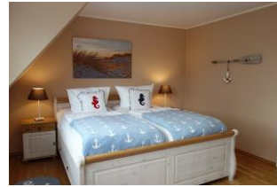
....noch einmal das Bett.