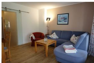
Das Wohnzimmer mit gemütlichem Sofa