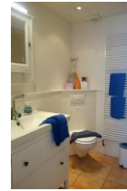
Das Badezimmer im Obergeschoß mit.....