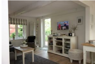
Blick ins Wohn-/Esszimmer