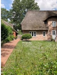
Die linke Hälfte des Hauses Buurnstrat 40 - WattLütt

Die Unterkunft verteilt sich über EG und 1.OG.