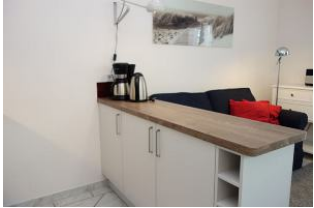
Die Küchenabtrennung, hier finden Sie Geschirr, Töpfe und Co.