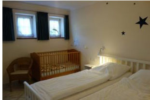
Großes Doppelbett und Holzbabybett...