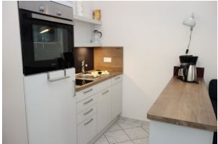
...hier noch einmal aus der Nähe.