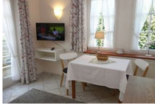
Esstisch und TV Gerät