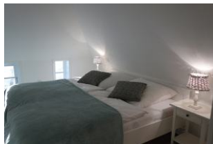
Das Doppelschlafzimmer (Bettmaß 180x200cm) im Obergeschoß...