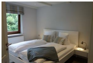
Ein Schlafzimmer mit großem Doppelbett (180x200cm, ohne Fussteil)....