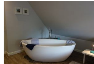
...und frei stehender Badewanne. Nach dem Bad: