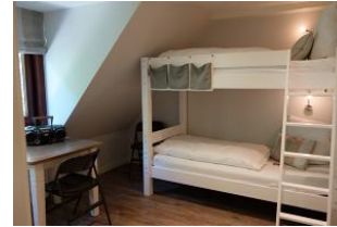
Ein Schlafzimmer mit Etagenbett.