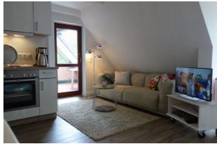
Die große Couch zum "langmachen"...

Entfernungen, zirka: zum Bäcker 700 m, zur Einkaufsmöglichkeit 2,0 km, zum Flughafen 3,0 km, zum Golfplatz 3,2 km, zum Hafen 2,5 km, zum ÖPNV 700 m, zum Badestrand 50 m, zum Ortszentrum 2,0 km