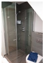
...und Duschkabine, aus Echtglas, sehr bequem: die Glaswand ist komplett weg zu klappen.