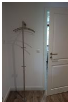
Der Flur mit Garderobe