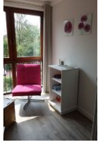
Schmökereistunde am Fenster.....