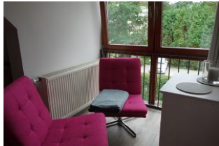
...sie stehen im Erker zum schmökern mit Blick ins Grüne !