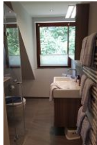
Das Bad mit Handwaschbecken und Toilette....