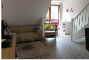
Das Wohnzimmer, die Treppe führt in das Schlafzimmer im Dachgeschoß