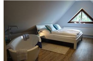
...WOW ... Das Schlafzimmer im Dachgeschoß