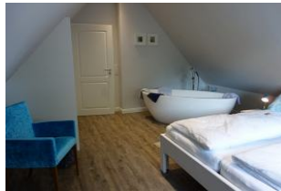
...mit gemütlichem Sessel....