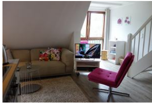
...schnell ist ein Sessel herbei gezogen,...