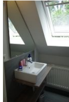
Das Gäste-WC im Dachgeschoß (nicht im Bild)