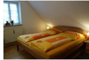
Ein großes Doppelbett für die Nachtruhe.