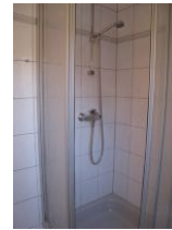
... Duschkabine; nicht im Bild: das WC