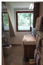
Das Bad mit Handwaschbecken und Toilette....