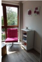
Schmökereistunde am Fenster.....