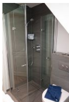
...und Duschkabine, aus Echtglas, sehr bequem: die Glaswand ist komplett weg zu klappen.