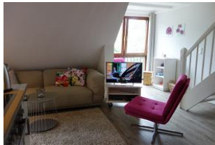
...schnell ist ein Sessel herbei gezogen,...