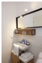
Das frisch (4/2023) renovierte Bad mit...

Entfernungen, zirka: zum Bäcker 300 m, zur Einkaufsmöglichkeit 800 m, zum Flugplatz 2,9 km, zum Golfplatz 3,0 km, zum Hafen 800 m, zum Meer 200 m, zum ÖPNV 400 m, zum Badestrand 200 m, zum Ortszentrum 800 m