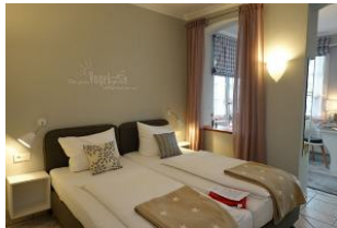
...hier dürfen Sie ausschlafen.