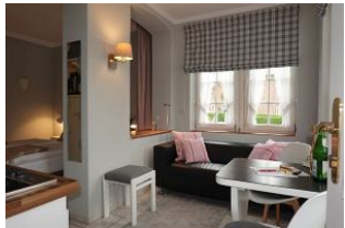
Das App. 2 im Haus Hallig Hooge

Ruhig gelegen, inmitten unseres kleinen Städtchens Wyk finden Sie unser Haus Hallig Hooge, welches insgesamt 7 Wohnungen für jeweils 2 Personen beherbergt. Klein, aber oho präsentiert sich auch das App. 2 - Nordstrandischmoor; ein großzügiges Einraum - Appartement für 2 Personen. Kleiner Wohnbereich mit Küchenpantry, eine halbhohe Mauer trennt den Wohn- vom Schlafbereich. Zugang zum Duschbad. Ein kleiner Abstellraum dient dem Unterstellen von Koffern und Taschen.