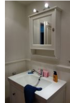
...Handwaschbecken und Spiegelschrank