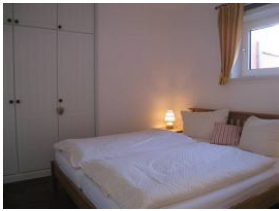
Das Schlafzimmer mit großem Doppelbett