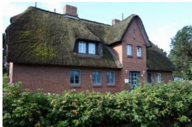
Das Haus Bredland 2a Die Whg.4 befindet sich im 1.OG links