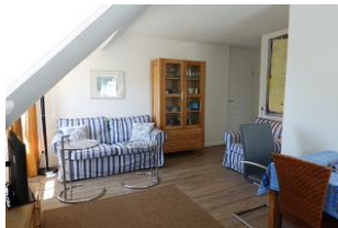
...und nehmen Sie platz für geruhsame Stunden.