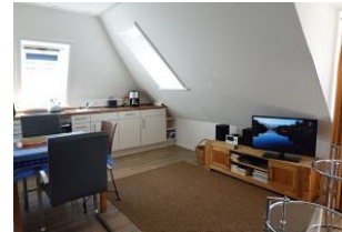
Das TV Gerät