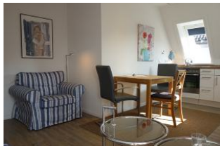
...großer Sessel, passend zur Couch.