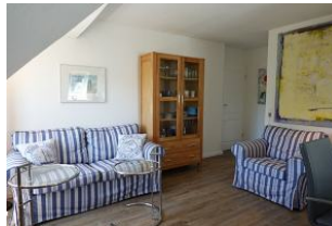
Couch und Sessel, beides sehr gemütlich, auch für einen langen TV-Abend geeignet.