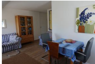
Ein Essplatz darf natürlich auch nicht fehlen