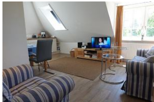
....treten Sie ein in diese "schnuckelige" Wohnung

Zauberhafte, helle Wohnung im 1.OG eines Zwei-Familienhauses. Im Juni 2011 komplett renoviert und mit viel Liebe zum Detail eingerichtet. Das Wohnzimmer mit offener Küchenzeile (sehr kommunikativ!), das Schlafzimmer mit zwei Einzelbetten, großem Einbauschränk und nicht zuletzt das neue Bad mit flacher Duschwanne für den bequemen Einstieg. Zudem wartet im Garten ein herrliches Plätzchen auf Sie....Lassen Sie es sich gut gehen und genießen Sie die Atmosphäre.