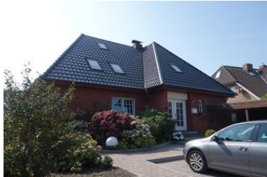
Die Außenansicht des Hauses Baben Dörp 13 in Wyk Boldixum