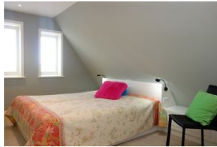
Das zweite Schlafzimmer. ebenfalls mit großem Doppelbett 180x200cm ohne Fussteil (nicht im Bild, das TV Gerät)