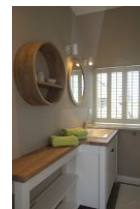
...und das dritte Bad...