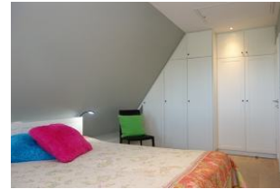
...und großem Einbauschrack.