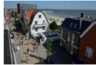
...über den Dächern von Wyk kann man den Blick bis zum Hafenanleger schweifen lassen.