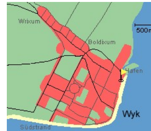
Entfernungen, zirka: zum Bäcker 30 m, zur Einkaufsmöglichkeit 350 m, zum Flugplatz 3,0 km, zum Golfplatz 3,0 km, zum Hafen 600 m, zum Meer 50 m, zum Badestrand 50 m, zum Ortszentrum 50 m