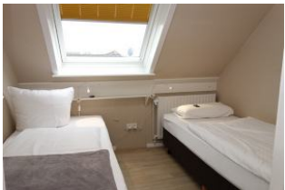
...wer mag, kann die Betten auch zusammen stellen, sie sind leicht zu bewegen.