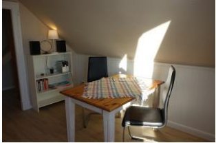
Der Essplatz im Wohnzimmer mit "frei schwingenden" Stühlen. Sehr bequem !