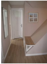
Der Flur mit Sitzbank