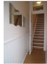
Die Treppe vom Hauseingang zur 1.Etage, spätestens nach dem Urlaub sind Sie fit.....