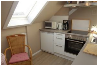
...Backofen und Mikrowelle