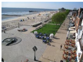
Der neu gestaltete Sandwall mit Gezeitenbrunnen