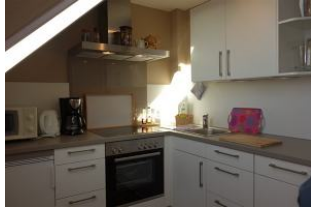
Die sep. Küche, jetzt auch mit Geschirrspüler...