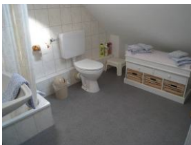
Kommode im Bad, auch als Sitzfläche zu nutzen