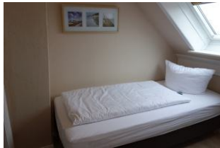
Das Schlafzimmer mit zwei Einzelbetten (Box-Spring-Betten)