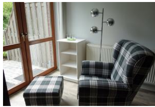
...mit Blick aus dem Fenster oder für eine Lesestunde ?