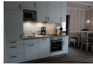
Die offene Küchenzeile, im Hintergrund der Essplatz