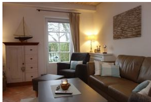
Ein großzügiges Wohnzimmer erwartet Sie... (im Hintergrund die Terrassentür)