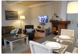
...mit Kamin und TV Gerät