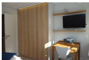
...auch hier ein TV Gerät