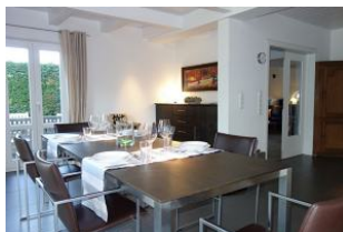
...nehmen Sie Platz!