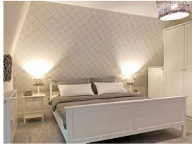
Das Schlafzimmer im Obergeschoß mit großem Doppelbett 180x200cm