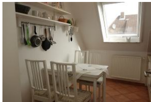
Der Essplatz in der Küche...