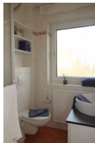
Das Bad mit großem Fenster...