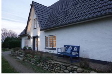
Die Aussenansicht des Hauses Friesengeist in Wrixum, Ohl Dörp 25

Die Unterkunft verteilt sich über EG und 1.OG.